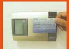
セキュリティカード