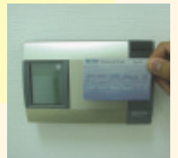
▲セキュリティカード

物件のご案内 ■所在/札幌市豊平区平岸3条7丁目1-27 ■物件名/第33藤井ビル ■構造/鉄骨鉄筋コンクリート造 地上10階建3階部分 ■交通/札幌市営地下鉄南北線「平岸」駅徒歩1分 ■駐車場/現地「収納スペースFuji専用駐車場」をご利用ください。 ■設備/オートロック(カード方式)、防犯カメラ、エレベーター、 専用台車 ■保証金1ヶ月 ■支払い方法/お支払いは北洋銀行の口座からの自動引落となります。